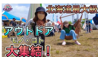
【FEELD GOOD FES.北海道】買ってよし！遊んでよし！食べてよし！なアウトドアフェス