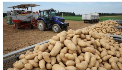
帯広市でジャガイモ収穫が最盛期

道新とUHBは地域に根差したメディアとして地元の魅力を取材し、膨大な量のコンテンツを蓄積してきました。北海道チャンネルは「動画百科事典」になることを目指し、食、レジャー、鉄道など多彩なジャンルの約2,000本（サイト開設時）を配信します。今後も地元メディアだからこそ撮影できる地域の穴場スポットやトレンド、旬の風景などのコンテンツを随時追加します。