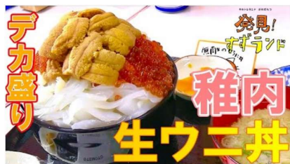
北海道・稚内で発見！贅沢デカ盛り海鮮丼「樺太食堂」【北海道グルメ】